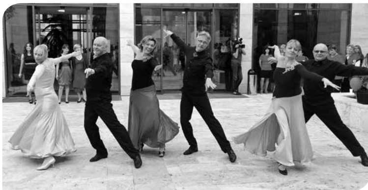
Az AKH Társastánc Klub bemutatója Budaörsön

Hosszú évek próbálkozása után fellendül a táncélet, amely azóta is meghatározó része az intézmény programjainak. A Tánc az Egészségért Alapítvány táncművészei elindítják az AKH Társastánc Klubot, ahol három csoportban is folyik az oktatás. Ekkor kezd a Divattánc tanoda is, amelyen az oktatás a jazz-balett és a színpadi show tánc alapelemeire épül. Elindul a Salsa iskola is, amely az egyik legnépszerűbb tanfolyama az intézménynek, sőt a tagjai a kerületi szabadtéri rendezvények rendszeres vendégei, s a táncbemutatóik sikeresen népszerűsítik az iskolát és a latin táncokat. A salsa sikerén felbuzdulva ma már zumba oktatással is várják a táncos lábú fiatalokat. Az idősebbek pedig a 2008-ban indult Senior Táncrend Klubban találkozhatnak hetente egy alkalommal, amely igen kedvelt közösségi és mozgásprogrammá vált.