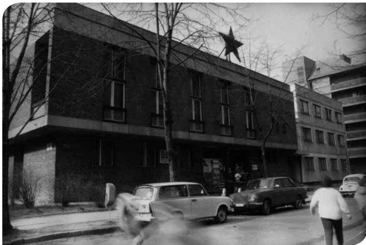
A Lágymányosi Községi Ház épülete a 80-as évek közepén