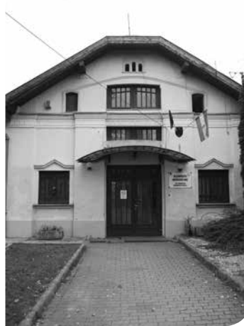
A közösségi ház napjainkban

Újbuda egyik leghangulatosabb, kertvárosias részének, Kelenvölgynek a beépítése az 1920-as, 30-as években volt a legintenzívebb. Ebben az időszakban, 1926-ban építették a Kelen mozit is, mely évtizedeken keresztül szolgálta a helyieket.