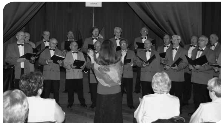
Az MKM Kelenvölgyi Férfikórus a Partnervárosi Kórustalálkozón 2008-ban

szintű munka külföldön is ismertté tette a nevüket. 2009-ben, a kórus megalakulásának 75. évfordulójára tartott koncerten például egy norvég kórus (Notodden Mannssengerforening) köszöntötte őket, de felléptek náluk Marosvásárhelyiek (Musica Humana Női Kamarakórus), angolok (Hepton Singers) is. A kórus alapítója és egyik szervezője a Staféta Férfikórus találkozó, melynek 2012-ben Kelenvölgy adott otthont. Sajnos napjainkban a kórus léte veszélybe került, a tagok megöregedtek, kihaltak, nincs utánpótlás, s így a próbák is leálltak az ősz folyamán. Csak remélhetjük, hogy a nagy múltú férfikórus története nem ér véget.