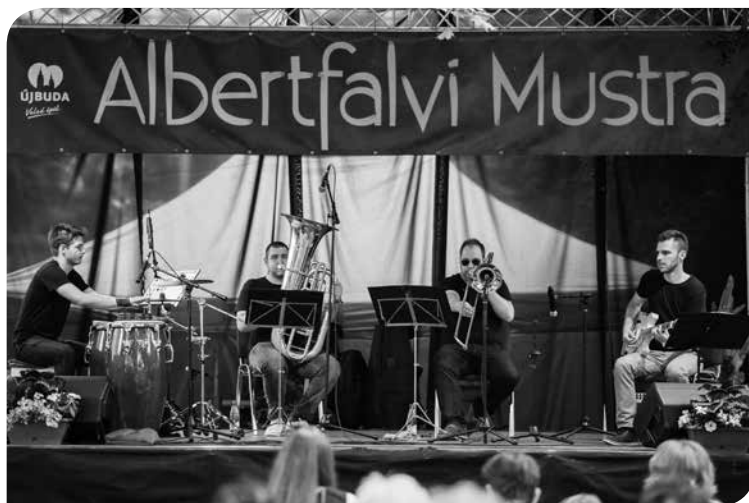
Az Albertfalvi Mustra színpadán a Chameleon Jazz Band

2014 májusában rendezik meg a Gyékényes utcában, a közösségi ház előtt a Mesterségek és Művészetek Mustráját, amely a következő évtől az Albertfalvi Mustra nevet viseli, s 2016-ban már Újbuda egyik leghangulatósabb eseményévé női ki magát. Az egész napos szabadtéri rendezvényen a délelőtt a gyerekek a helyi iskolák művészeti csoportjainak a bemutatóival, bábszínházzal és kézműves foglalkozásokkal tarkítva. A délután pedig az árnyas lombok alatt a komolyabb művészeteké (táncszínház, jazz, nép- és komolyzene stb.). Közben kirakodóvásár, mesterség bemutató, helytörténeti kiállítás és egyéb izgalmas programok is várják az érdeklődőket. Este pedig, ahogy sötétedik, a fák ágai között lampionok világítanak. Kezdődik az utcából, ahol a környék apraja-nagyja együtt táncolhat egy tartalmas nap lezárásaként.