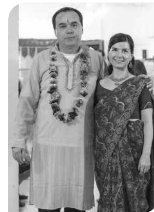
A szervezők beöltözve fogadják a 2014-es indiai nap vendégeit

2016 januárjában összenyitják az emeleti tetőteret és a klubszobát, amelyekből egy kiállítótér alakítanak ki. Ugyanis az intézménybe költözik az Etele Helytörténeti Gyűjtemény, amelyet február 3-án adnak át ünnepélyes