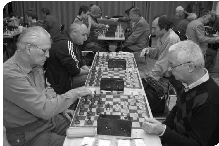
Ádáz küzdelem a Gazdagrét Kupáért

2007. november 11-én, a XI. kerület Napján új hagyományt indítanak az útjára: a Gazdagrét Kupa Sakkversenyt, amely mind a mai napig a ház egyik legrangosabb sporteseménye.