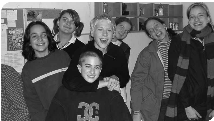
A kRÉTa diáklap szerkesztősége

Az újság a maga nemében egyedülálló, hiszen nem egy iskolához kötődik, hanem egy városrészhez – Gazdagréthez –, s így a szerkesztőség tagjai is két általános iskolába (Csiki+Török) járnak. A kRÉTa kéthavonta fog megjelenni, s minden gazdagréti diák ingyenesen kapja meg.