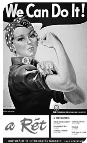
A Rét magazin egyik címlapja