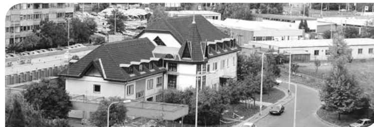
A közösségi ház épülete „madártávlatból”

Az Órmezei Községi Ház a kerület első közösségi háza, amely 1979-ben épült, hogy az új lakótelepen élők közösségi, kulturális, információs, szórakozási és mozgásigényét szolgálja. 1980-ban még bizonytalan státusszal indult, majd a XI. kerületi Tanács Művelődési Osztályának fenntartásában üzemelt, 1981-től pedig már saját költségvetéssel működött. A 80-as évek folyamán a többi közösségi ház, a Bartók 32 Galéria és a Kamaraerdei Ifjúsági Park belépése során szerveződött a XI. kerületi Közművelődési Intézmények Igazgatósága, mely intézmény fennállása alatt az Órmezei Községi Ház részben önálló művelődési házként funkcionált.