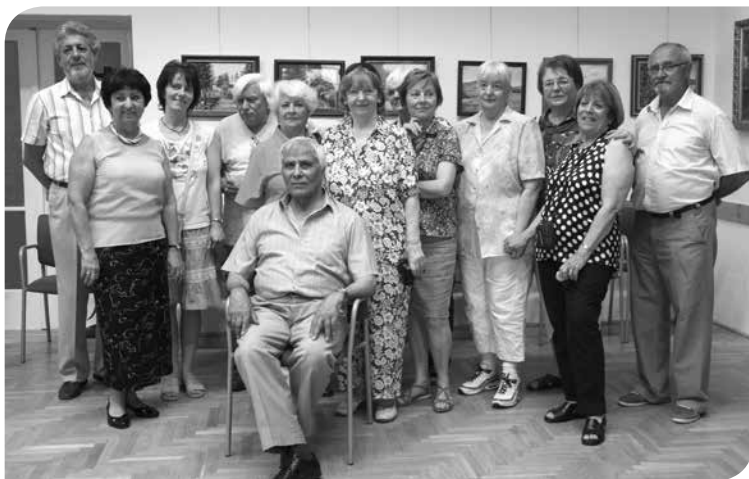
A Kelenvölgyi Festőiskola