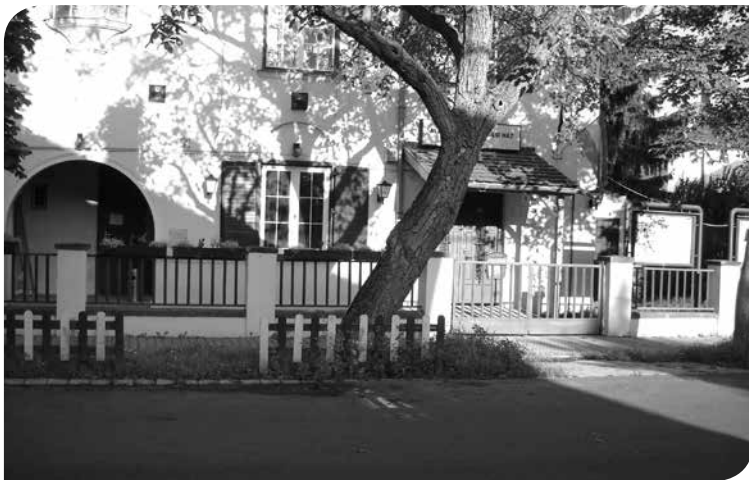
Albertfalvi Községi Ház

A mai Albertfalvi Községi Ház kétszintes épülete valószínűleg hamarosan közösségi célokat szolgált. Visszaemlékezések szerint a háború előtt a Szociáldemokrata Párt háza volt és az emeleti részén könyvtár is működött. A később hozzáépített traktusban – ez már 1950. január 1-jével, Albertfalva önállóságának megszűntetése és a XI. kerülethez való csatolása után történt – színháztermet alakítottak ki. Itt működött a Magyar Kommunista Párt (MKP), majd az Magyar Szocialista Munkáspárt helyi szervezete, illetve a Vöröskereszt egyik albertfalvi csoportja is. Az idősebbek sok kulturális műsorra emlékeznek ebből az időből.