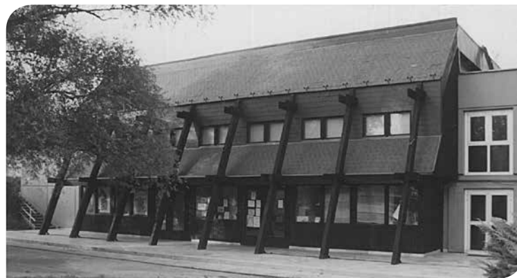
A volt VSZM Községi Ház Galvani utca felé néző homlokzata

A közösségi ház kettős fenntartásban kezdte meg működését. A közüzemi díjakat és a dolgozókat először a gyár fizette, a programokra a XI. kerületi Tanács biztosított anyagi fedezetet. A gyár idővel kihátrált az üzemeltetésből, és a 80-es évek végére teljesen a Közművelődési Intézmények Igazgatóságához került át a fenntartás.