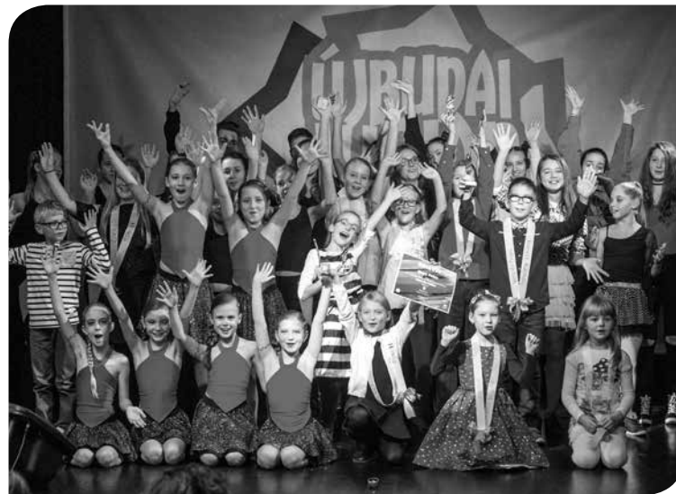
A 2016-os Újbudai Junior Ki Mit Tud győztesei

illetve egyéni és csoporttánc kategóriákban érkeztek nevezések. A kategóriákon túl korcsoport szerinti bontásban hirdettek eredményt, s a nyertes produkciók előadói a közösségi ház gálaműsorán is felléptek a nagydíjért. A továbbiakban a versengést – felváltva a 60+ program keretében szervezett Senior Ki Mit Tud versennyel – két évente fogják megrendezni.