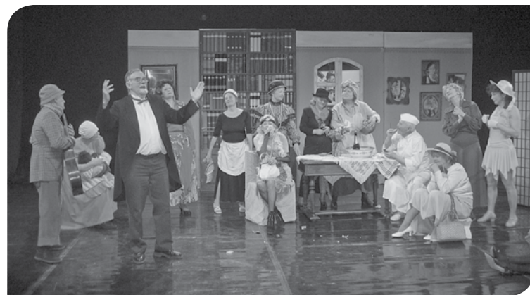
Heltai Jenő: A nagy nő – a Tarka Színpad előadásában (2006)