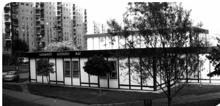
A közösségi ház épülete egy Trabanttal a kezdeti években

A közintézmények átadása az építkezés üteméhez igazodott. A Törökugrató utcai Általános Iskola, az óvoda és a bölcsőde után, 1985. november 1-jén nyitotta meg a kapuit a Gazdagréti Községi Ház. Az épületben egy tágas előtér, egy abból nyíló többfunkciós nagyterem, klubszoba és irodahelyiségek lettek kialakítva 3 .