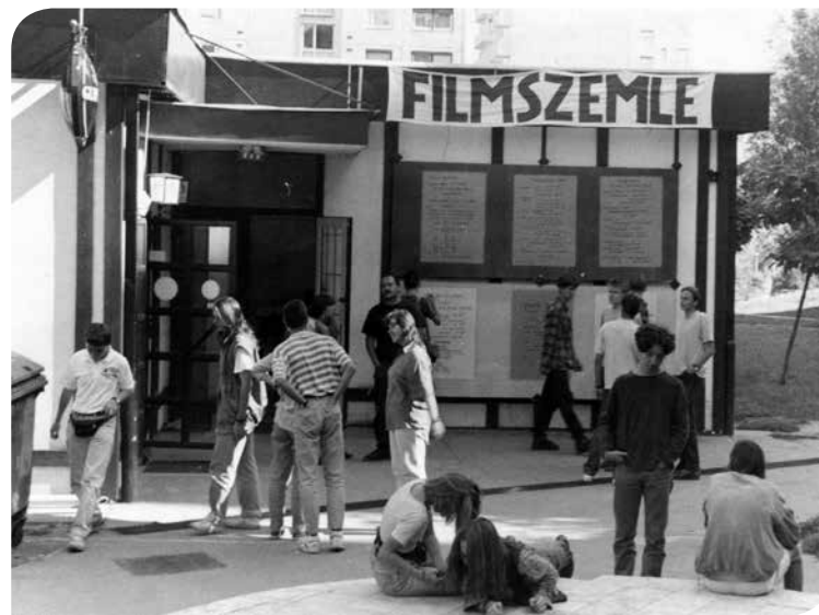
Egy kis szünet az I. Diákfilmszemlén