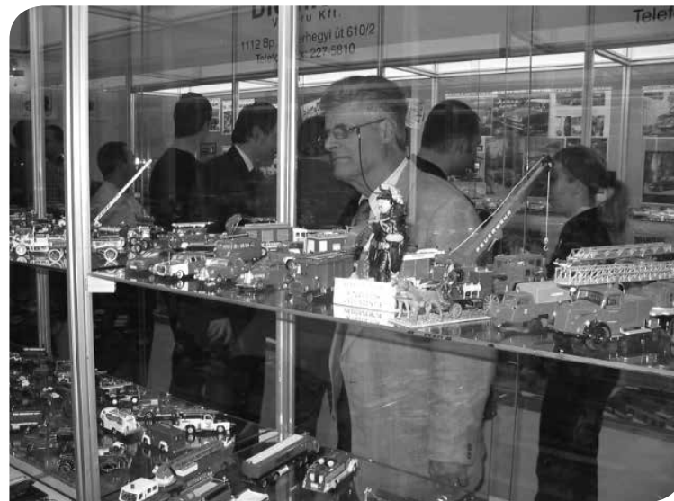
Autómodellek és érdeklődők a 2004-es kiállításon

s nem a gyártókat. Így nem egyszer rendkívül egyedi és értékes ritka autósodák is előkerültek, aminek eredményeként a kiállítás nemzetközi hírnevet vívott ki magának.