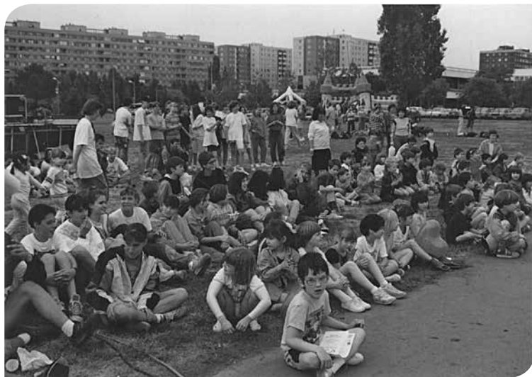
Gyermeknap Kelenföldön (80-as évek)