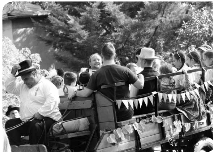
Lovas kocsis szüreti felvonulás a 2016-os Kelenvölgyi Ezerjón

A KKH minden évben szervez nyári táborokat. A legnagyobb hagyománnyal rendelkező tábor a Szarvasi Kamarazenei Tábor volt, melyre zenei pályára készülő fiatalok jártak, de népszerűek voltak a cserkész-, a néptánc- és a focitáborok, napjainkban pedig bábos-, valamint drámapedagógiai táborokat szerveznek.