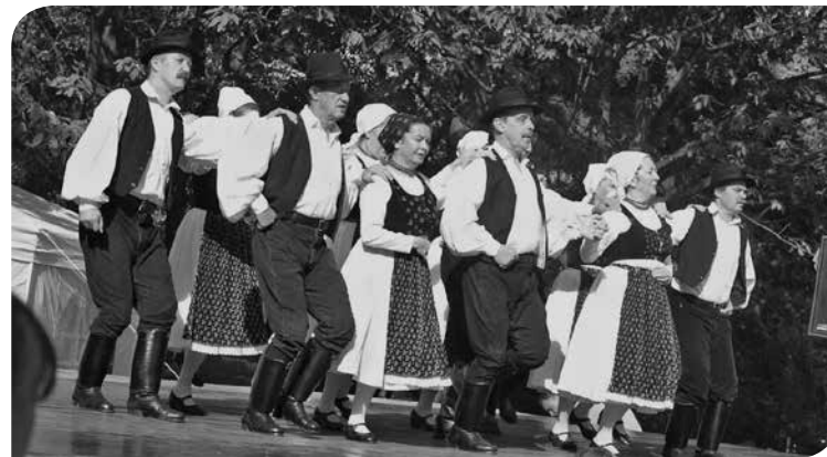
A Cavinton Néptáncegyüttes fellépése Őrmező Ünnepe (2008)

2001 óta a közösségi ház egyik legsikeresebb rendezvénye a Jancsó Adrienne vers-és prózamondó verseny. A másfél évtizede szervezett vetélkedés immáron jelentős hazai szavalóverseny, melyen az első három évben maga Jancsó Adrienne is zsűritagként vett részt.